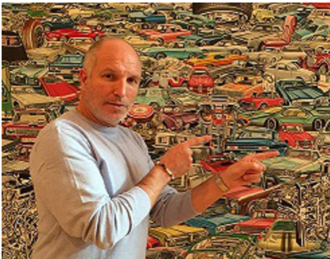
toile de ERRO "carscape" de 1970